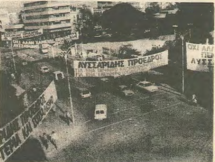
Η πιο έντονη και δαπανηρη προεκλογική εκστρατεία στην ιστορία της Κύπρου.

Οι απλοι Ακελικοί έβλεπαν με προβληματισμο και αμφισβήτηση την τακτική που η ηγεσία τους ακολούθησε δίνοντας για